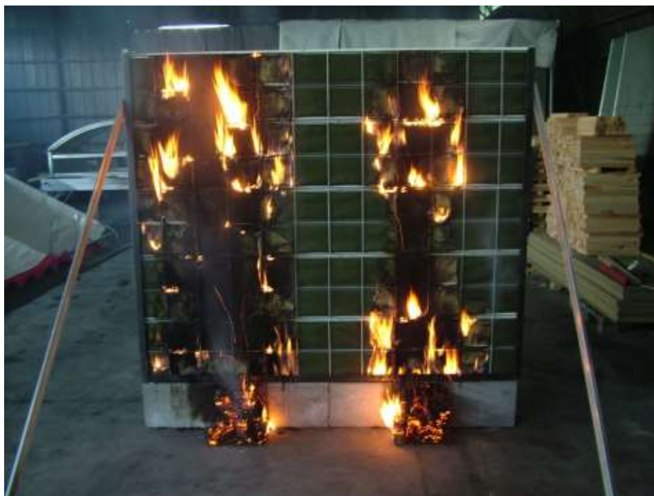
Ryc. 4. Badanie ekranu przeciwhałasowego zgodnie z wymaganiami PN-EN 1794-2