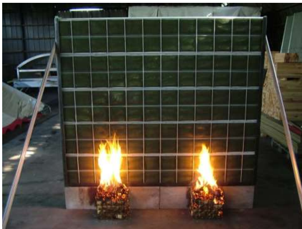
Ryc. 3. Początkowe stadium badania ekranu przeciwhałasowego zgodnie z wymaganiami PN-EN 1794-2