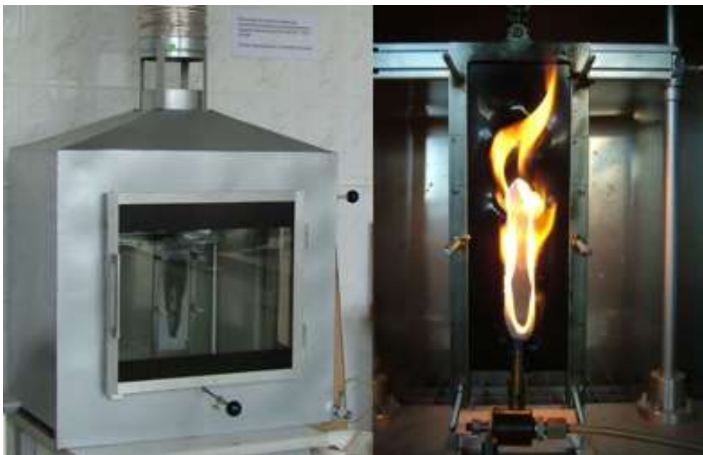
Ryc. 8. Stanowisko badawcze wg PN-EN ISO 11925-2