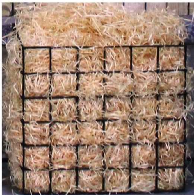
Ryc. 2. Prostopadłościenny kosz wypełniony strużynami zgodnie z wymaganiami PN-EN 1794-2:2011

Bardzo istotnym elementem przeprowadzenia badania jest przygotowanie źródeł zapłonu. Materiał palny stanowią strużyny świerkowe o grubości 0,2 mm, szerokości 2 mm i długości około 50 mm oraz wilgotności maksymalnie 30%. Masę 600 g strużyn umieszcza się w odpowiednio do tego przygotowanych drucianych koszach o wymiarach zewnętrznych 300 x 200 mm i wysokości 300 mm wykonanych z drutów o średnicy 3 mm z kwadratowymi oczkami o boku 50 mm. Materiał palny (strużyny) należy kondycjonować w temperaturze 20°C i wilgotności 65% do momentu osiągnięcia stałej masy.