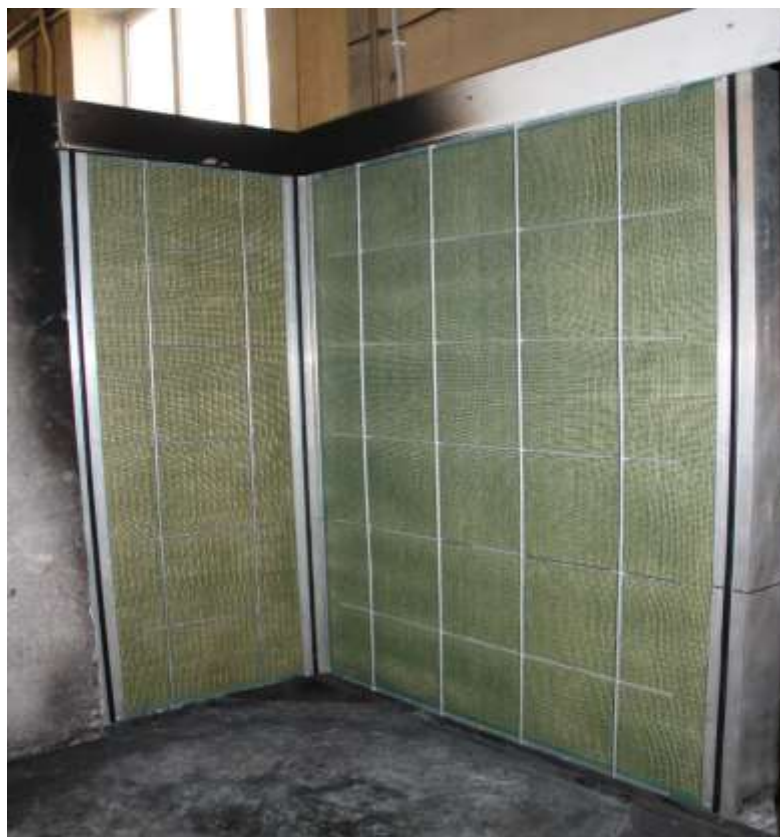
Ryc. 7. Ułożenie próbek badanego wyrobu na stanowisku badawczym