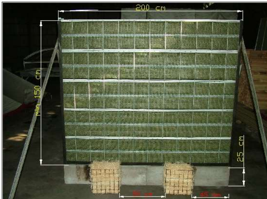
Ryc. 1. Stanowisko badawcze do badania ekranu akustycznego z zamocowaną próbką (ekran typu zielona ściana) zgodnie z wymaganiami PN-EN 1794-2:2011

Pomieszczenie badawcze może być wyposażone w odciągi gazów spalinowych na suficie lub blisko niego pod warunkiem odpowiedniego zabezpieczenia przed podsycaniem ognia. Temperatura w pomieszczeniu badawczym powinna mieścić się w zakresie od 15°C do 25°C.