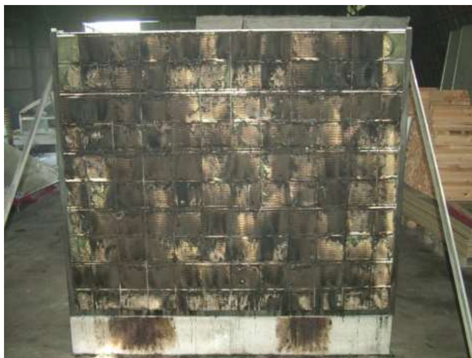
Ryc. 5. Ekran przeciwhałasowy po badaniach, etap klasyfikacji ekranu – tu klasa 1