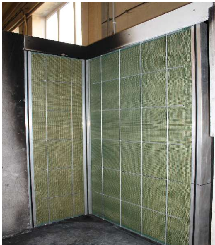
Ryc. 6. Komora badawcza stanowiska badawczego wg PN-EN 13823

W czasie trwania testu, który trwa 1560 s) należy obserwować zachowanie próbki. Obserwacje dokonywane przez operatora stanowiska dotyczą bocznego rozprzestrzeniania płomienia (LFS) oraz występowania spadających i płonących cząstek lub kropli.