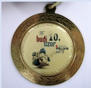
16. Złoty medal i dyplom od World Invention Intellectual Property Associations, 39. edycji Międzynarodowych Targów Wynalazczości „INOVA CROATIA 2014”, Osijek 2014