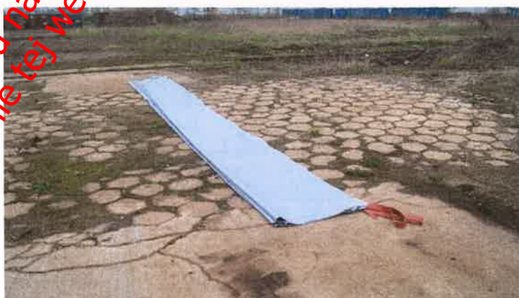
Fot. nr 2 Samochodowa płachta gaśnicza Padtex typu PAD-CFB-M-1 w rozmiarze 6 x 8m

(przygotowana do użycia w pierwszym teście pożarowym)