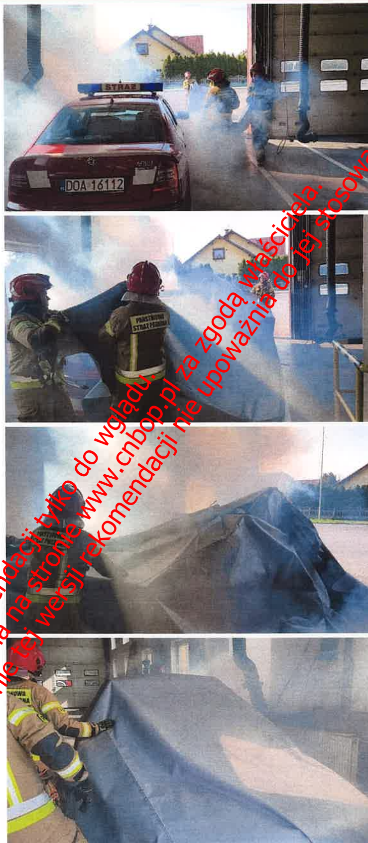
Fot. nr 7 - 10 Nakładanie płachty Padtex typu PAD-CFB-M-1 na pojazd zaparkowany w garażu JRG Oława