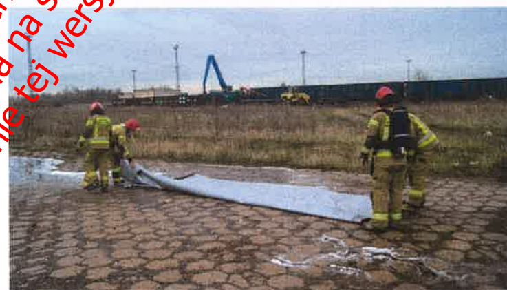
Fot. nr 27 Płachta Padtex typu PAD-CFB-M-1 przygotowywana do ponownego użycia