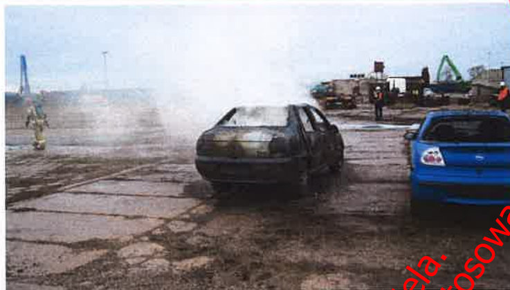
Fot. nr 25 Pojazd po zdjęciu płachty Padtex typu PAD-CFB-M-1

Płachtę poddano oględzinom w celu wykrycia ewentualnych uszkodzeń i przepaleń. Następnie przemyto wodą oraz przygotowano do ponownego użycia przy drugim pożarze.