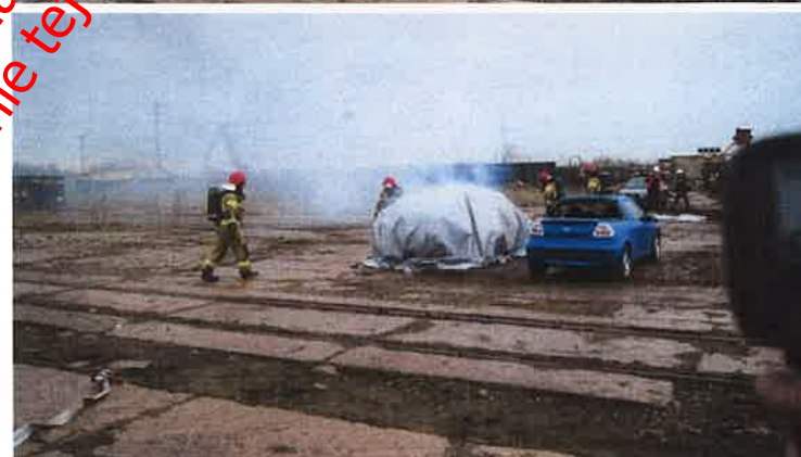
Fot. nr 15- 18 Nakładanie płachty Padtex typu PAD-CFB-M-1 na płonący pojazd