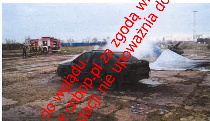
Fot. nr 41 Pojazd po zdjęciu płachty Padtex typu PAD-CFB-M-1