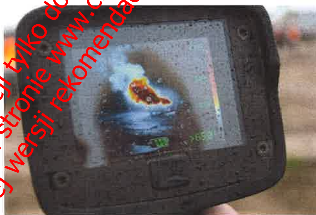
Fot. nr 20 Pomiar temperatury kamerą termowizyjną 3M™ Scott™ V320