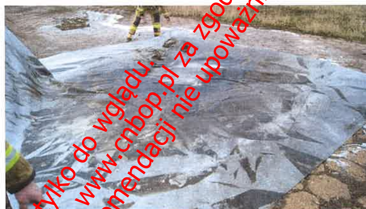
Fot. nr 26 Płachta Padtex typu PAD-CFB-M-1 po jednym użyciu i przemyciu wodą

Płachtę poddano oględzinom w celu wykrycia ewentualnych uszkodzeń i przepaleń. Następnie przemyto wodą oraz przygotowano do ponownego użycia przy drugim pożarze.