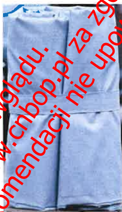
Fot. nr 1 Samochodowa płachta gaśnicza PADTEX typu PAD-CFB-M-1

Samochodowa płachta gaśnicza Padtex typu PAD-CFB-M-1 jest wykonana z włókna szklanego pokrytego silikonem. Samochodowa płachta gaśnicza Padtex typu PAD-CFB-M-1 posiada certyfikat nr 3848/2023 wydany w dniu 10.02.2023 przez Inspecta Latvia, A/S na zgodność z normą LVS 1071:2022 Car fire blankets jako płachta wielorazowego użytku.