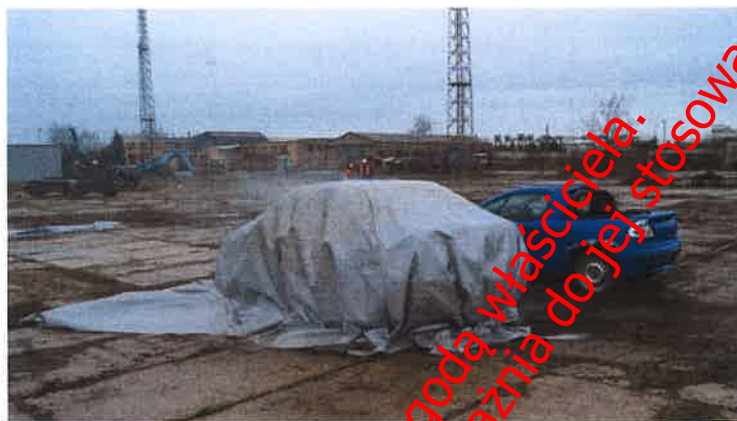
Fot. nr 19 Pojazd przykryty samochodową płachtą gaśniczą Padtex typu PAD-CFB-M-1