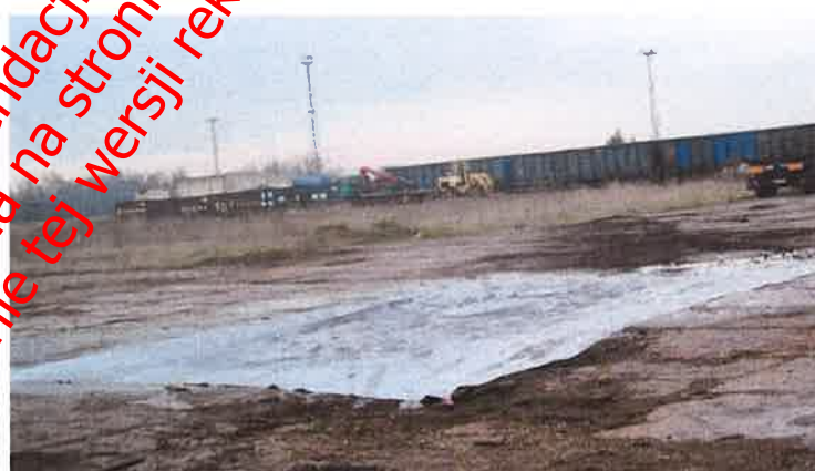
Fot. nr 42 Płachta Padtex typu PAD-CFB-M-1 po dwukrotnym użyciu

Płachtę poddano oględzinom w celu wykrycia ewentualnych uszkodzeń i przepaleń. Następnie przemyto wodą.