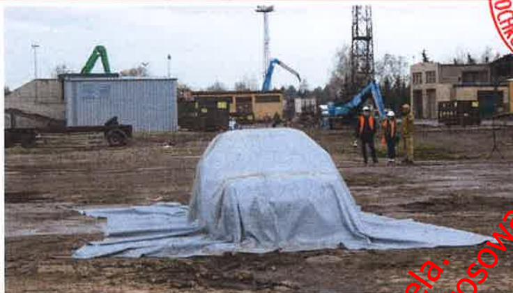
Fot. nr 40 Pojazd przykryty samochodową płachtą gaśniczą Padtex typu PAD-CFB-M-1