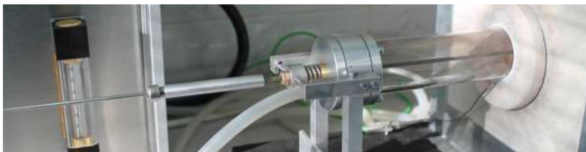
Ryc. 3. System do wprowadzania próbki