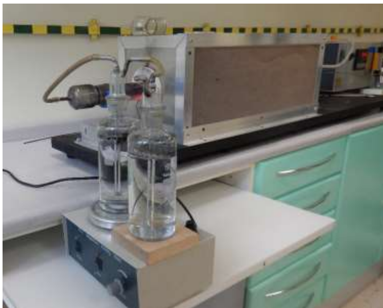
Ryc. 4. Układ płuczek

Woda umieszczona w płuczkach powinna być destylowana lub demineralizowana, natomiast pH wody powinno zawierać się między 5,5 a 7,5. Konduktywność powinna wynosić mniej niż 0,5 \mu\text{S}/\text{mm} .